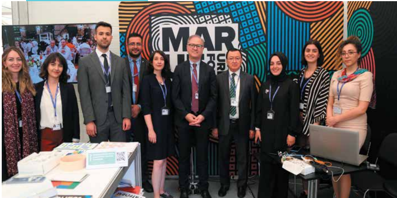
قام وفد UCLG-MEWA بزيارة جناح MMU في منطقة المعرض بالمنتدى.

أعضاء UCLG-MEWA كان لديهم أيضا جدول مزدحم خلال الحدث. شاركت فاطمة شاهين ، رئيسة بلدية غازي عنتاب الكبرى ورئيسة اتحاد بلديات تركيا. كمتحدثة في جلسات "التنمية البشرية وبناء السلام" و "الأولويات تحت الضغط" و "نحو تحسين إدارة الهجرة الحضرية" و "الأعمال التي تفوقها"