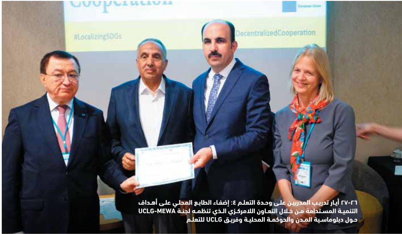
٢٧-٢٦ أيار تدريب المديرين على وحدة التعلم ٤: إضفاء الطابع المحلي على أهداف التنمية المستدامة من خلال التعاون اللامركزي الذي تنظمه لجنة UCLG-MEWA حول دبلوماسية المدن والحكومة المحلية وفريق UCLG للتعلم