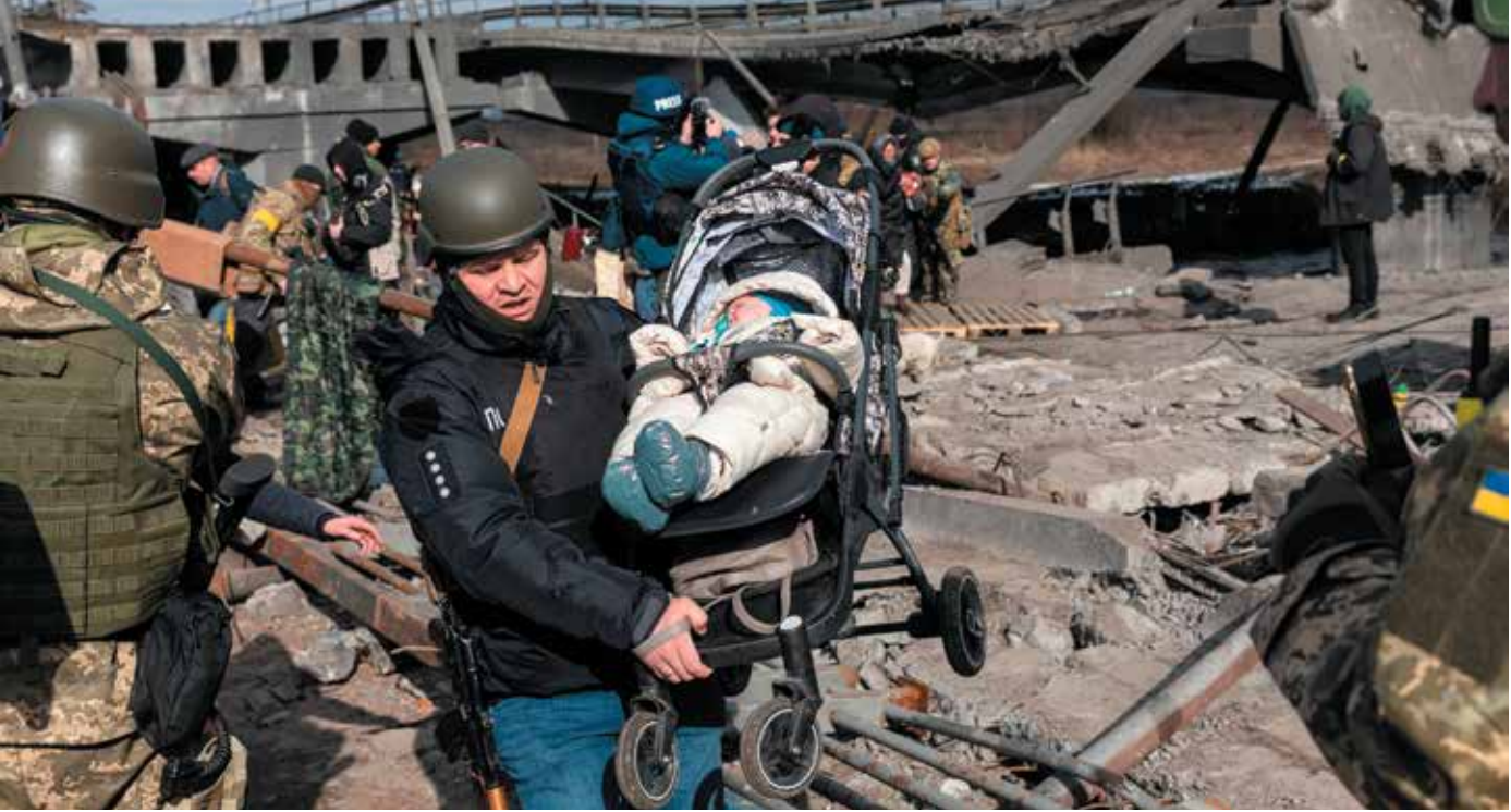
إيربين ، أوكرانيا - ٩ مارس ٢٠٢٢: الحرب في أوكرانيا. اضطر الآلاف من سكان إيربين إلى مغادرة منازلهم وإخلاء منازلهم بينما تقوم القوات الروسية بقصف مدينة مسالمة. لاجئو الحرب في أوكرانيا.