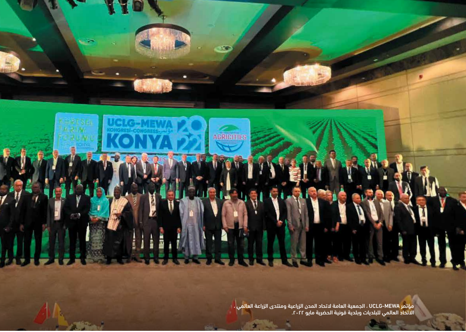
مؤتمر UCLG-MEWA ، الجمعية العامة لاتحاد المدن الزراعية ومنتدى الزراعة العالمي ، الاتحاد العالمي للبلديات وبلدية قونية الحضرية مايو ٢٠٢٢ .

في الجمعية العمومية، تم إجراء تحديثات بشأن نظام رسوم العضوية والموظفين والهيكل الإداري في الدستور واللوائح. لم يتم اتخاذ أي قرار بشأن المدن التي ستستضيف الاجتماعات الإدارية القادمة لمنظمة UCLG-MEWA.