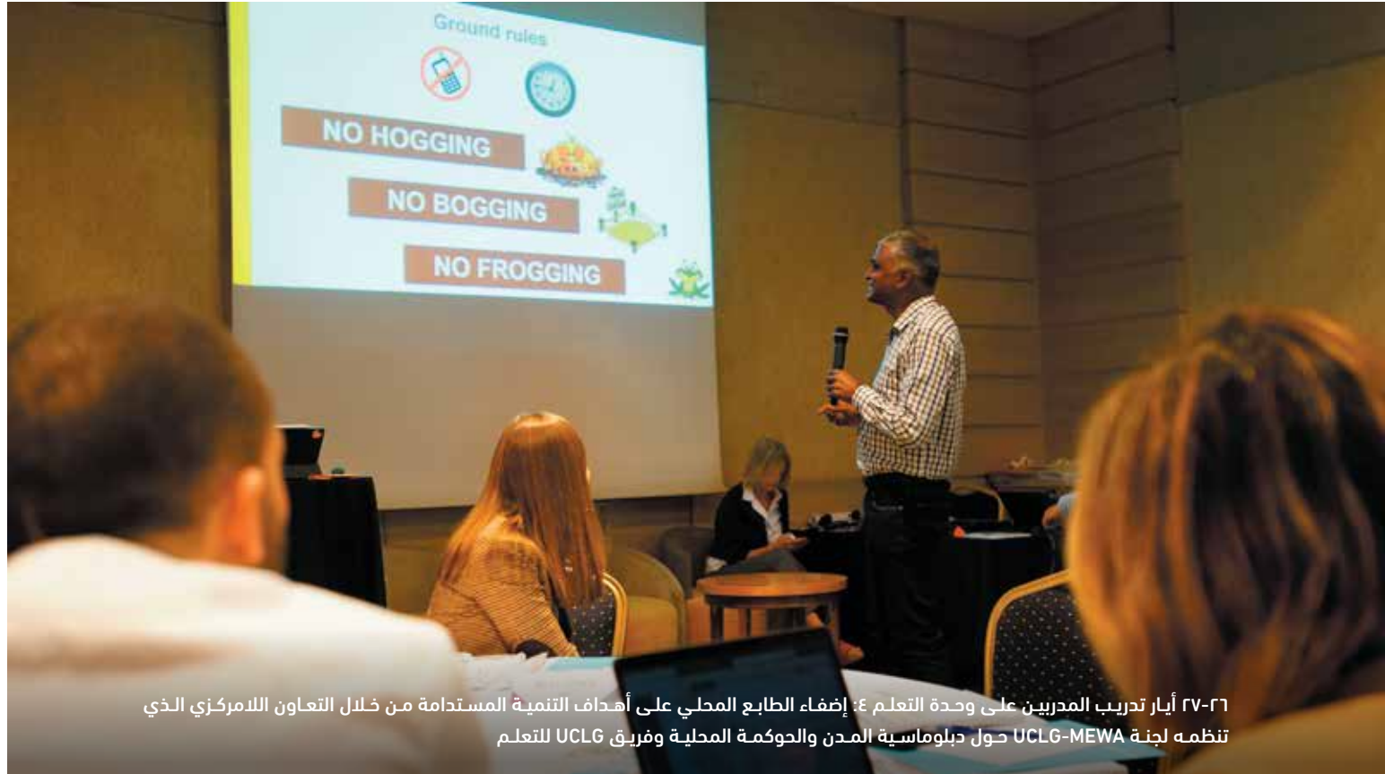
٢٧-٢٦ أيار تدريب المدربين على وحدة التعلم ٤: إضفاء الطابع المحلي على أهداف التنمية المستدامة من خلال التعاون اللامركزي الذي تنظمه لجنة UCLG-MEWA حول دبلوماسية المدن والحكومة المحلية وفريق UCLG للتعليم