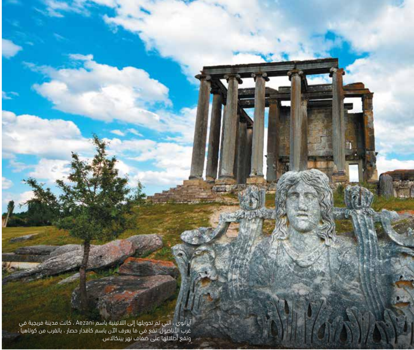
أيزانوي ، التي تم تحويلها إلى اللاتينية باسم Aezani ، كانت مدينة فريجية في غرب الأناضول. تقع في ما يعرف الآن باسم كافدار حصار ، بالقرب من كوتاهيا ، وتقع أطلالها على ضفاف نهر بينكلاس.

انتشرت جائحة Covid-19 من ووهان ، الصين ، وأصاب العالم بأسره. تأثرت كوتاهيا بهذه الجائحة أيضًا. تهدف المدينة إلى التخفيف من الجوانب السلبية لـ Covid-19 من خلال اعتبار هذه الجائحة فترة حضانة لتدريب الفنانين والحرفيين في المدينة. تقدمت المدينة بطلب للحصول على النسخة الخامسة من الجوائز الثقافية من UCLG مع هذا المشروع وتم الاعتراف بها تحت عنوان أفضل عمل بعنوان "التخطيط بعناية".