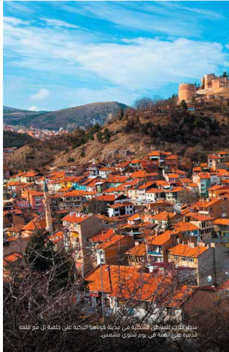
منظر خلّاب للمناطق السكنية في مدينة كوتاهيا التركية على خلفية تل مع قلعة مدمرة على القمة في يوم شتوي مشمس.