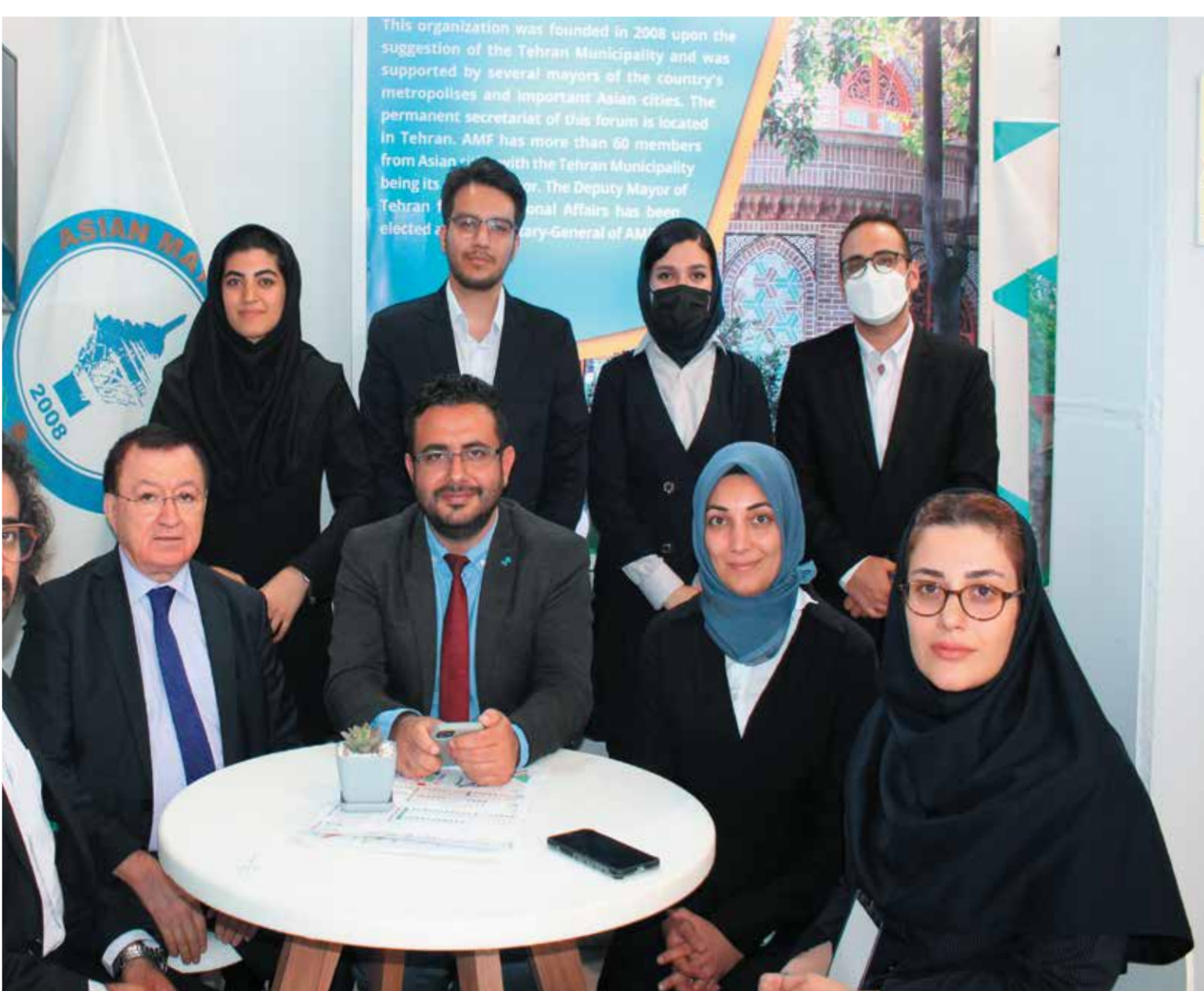
معرض مدينة إيران الذكية الثالث الذي تنظمه وزارة الداخلية الإيرانية