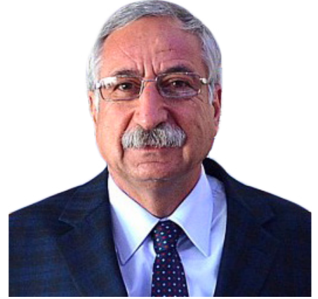
Nidai GÜNGÖRDÜ Girne Belediye Başkanı

Kişiler ve kurumların desteğiyle, insanın her dönem ve durumuna göre düzenlenecek yaşam alanları yanında, yardıma ihtiyaç duymadan turizm faaliyetlerini sürdürebilmesi sosyal ve kültürel yaşamın içerisinde yer alabilmesi, yaşam kalitesini artırmak konusunda ortaya konulan görüş ve öneriler bu konuda atılacak adımlar için önemli bir kaynak olacaktır.